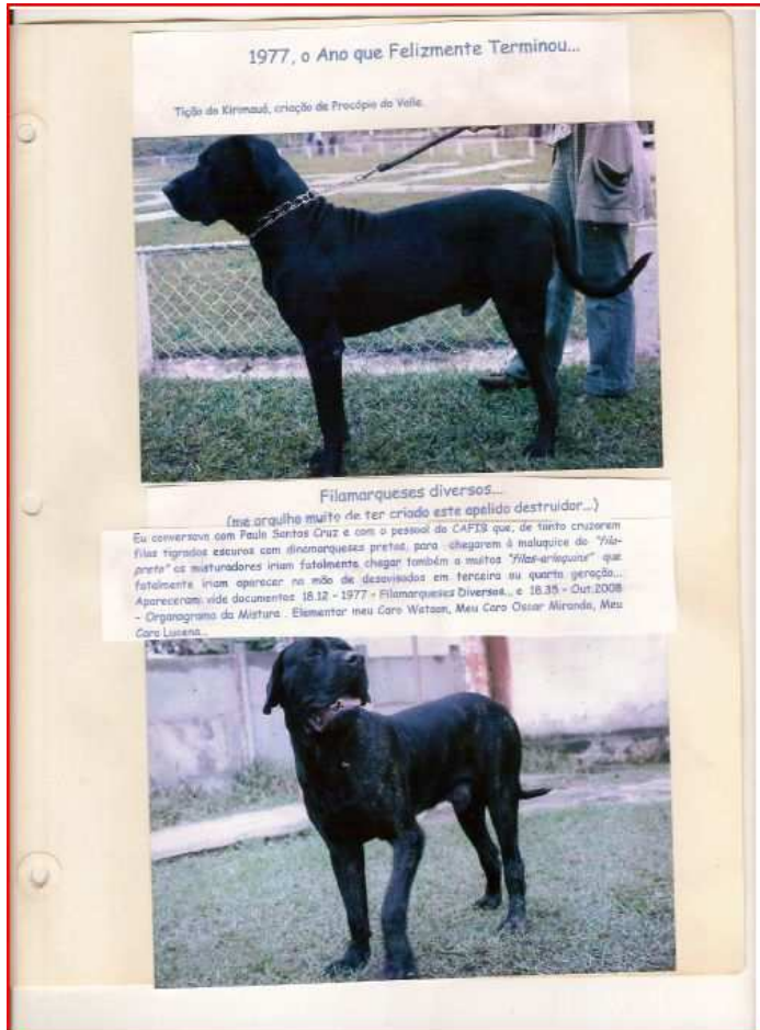
Foto 5 – De FILAMARQUES* en anderen, afkomstig uit meerdere mixen (Filamarques = Fila x Danimarques ; Fila x Deense Dog, noot vertaler)

Hiernaast zien we twee hondenfotos, een zwarte die typisch filamarques is en de andere, een niet te definiëren exemplaar dat in het fenotype meerdere rassen bovenop de filamarques toont.