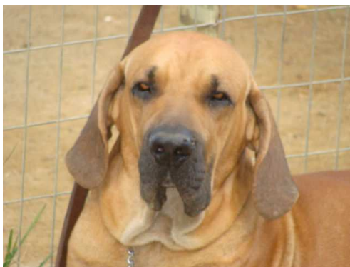
Foto 4-B Hoofd van een Fila Brasileiro Originele Standaard

In het geval van de fotos 4 en 4 C, zien we een nog slechtere situatie (is slechter dan de vorige mogelijk ?) Hier ziet men duidelijk de eigenschappen van de geïmporteerde Mastiffs, maar ook zijn er enkele eigenschappen die tot de Mastino Napolitanos behoren. Het figuur is grotesk, op het absurde af en pachydermisch (lijkt op dikhuidig zoogdier, noot vertaler). Het is een combinatie van overdreven corpulentie, kortlijnig type, korte poten, erg diepe snuit en lippen, liplijn in omgekeerde V in tegenstelling tot hetgeen de Standaard voorschrijft: liplijn in omgekeerde diepe U (zie “snuit” in de tekst van de Standaard), Chinees aandoende ogen die verstopt zitten onder de atypische overtollige huid die zich op de schedel bevindt. Zelfs in staat van alert zijn, ziet hij er verveeld uit. De kleur cinza-kaneel is gebruikelijk bij exemplaren van dit soort.